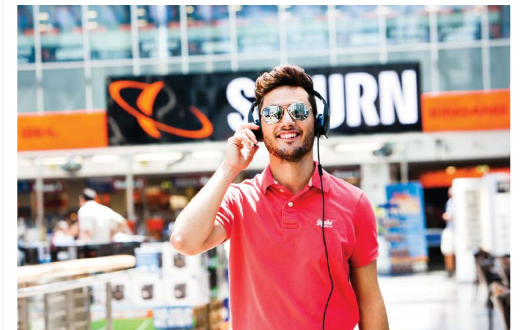
DIE UCI KINOWELT MILLENNIUM CITY IST ÖSTERREICHS GRÖSSTES KINO.